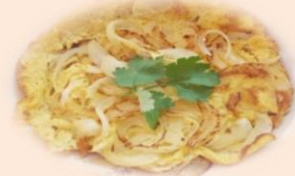
เมนู “ไข่เจียวหอมใหญ่” (ช่วยเสริมภูมิคุ้มกัน)

ใบกระเพรา: มีสาร orientine เป็นสารสำคัญที่มีศักยภาพป้องกันไม่ให้เชื้อไวรัสเข้าสู่เซลล์ ลดโอกาสการติดเชื้อของเซลล์ ช่วยป้องกันไม่ให้ป่วยจากเชื้อไวรัส 14-15