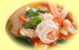
เมนู “ต้มยำกุ้ง” (ช่วยเสริมภูมิคุ้มกัน ต้านการอักเสบ ต้านไวรัส)

ไข่: แหล่งโปรตีนชั้นดี ช่วยสร้างภูมิคุ้มกัน ผักรหวาน: วิตามินเอสูง ใบมีรสหวานเย็น ใช้ปรุงเป็นยาเขียว แก้ไข้ พบฤทธิ์ต้านการอักเสบและกระตุ้นภูมิคุ้มกัน 7,15