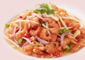
เมนู “ยำกุ้งแห้งจิงสด” (ช่วยเสริมภูมิคุ้มกัน ต้านการอักเสบ ต้านไวรัส)

หัวหอม: มีสารเคอซิทิน (Quercetin) ช่วยป้องกันไม่ให้ไวรัสเข้าสู่เซลล์ มีฤทธิ์ในการป้องกันการอักเสบ 14-15 มะเขือเทศ: Betacarotene พบในผัก ผลไม้สีเหลือง สีส้ม สีแดง เช่น มะเขือเทศ มีฤทธิ์ปรับภูมิคุ้มกัน และต้านอนุมูลอิสระได้ดีมาก เนื้อไก่: แหล่งโปรตีนคุณภาพดี เป็นส่วนประกอบที่สำคัญของระบบภูมิคุ้มกัน