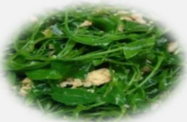
เมนู “ผักรหวานผัดไข่” (ต้านการอักเสบ กระตุ้นภูมิคุ้มกัน)

ไข่: แหล่งโปรตีนชั้นดี ช่วยเสริมภูมิคุ้มกัน หอมใหญ่: มีสารเคอซิทิน (Quercetin) ช่วยป้องกันไม่ให้ไวรัสเข้าสู่เซลล์มีฤทธิ์ในการป้องกันการอักเสบ 15