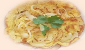
เมนู “ไข่เจียวหอมใหญ่”

ใบกระเพรา: มีสาร orientine เป็นสารสำคัญที่มีศักยภาพป้องกันไม่ให้เชื้อไวรัสเข้าสู่เซลล์ ลดโอกาสการติดเชื้อของเซลล์ ช่วยป้องกันไม่ให้ป่วยจากเชื้อไวรัส 14-15