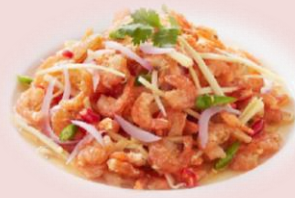
เมนู “ยำกุ้งแห้งจิงสด”

เนื้อไก่: แหล่งโปรตีนคุณภาพดี เป็นส่วนประกอบที่สำคัญของระบบภูมิคุ้มกัน