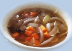
เมนู “ซุสหัวหอม” (ต้านอนุมูลอิสระ เสริมภูมิคุ้มกัน)

เครื่องเทศ: ช่วยเพิ่มภูมิคุ้มกัน ต้านไวรัส ต้านการอักเสบ ช่วยย่อย มะนาว: ละลายเสมหะ ช่วยย่อย มีสารต้านไวรัส 14-15