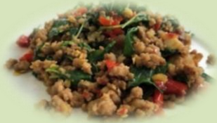
เมนู “ผัดกระเพรา”

ใบกระเพรา: มีสาร orientine เป็นสารสำคัญที่มีศักยภาพป้องกันไม่ให้เชื้อไวรัสเข้าสู่เซลล์ ลดโอกาสการติดเชื้อของเซลล์ ช่วยป้องกันไม่ให้ป่วยจากเชื้อไวรัส 14-15