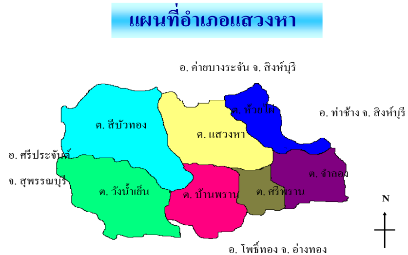
ภาพที่ ๑ แผนที่อำเภอแสวงหา

๒.๑) แผนที่ (แสดงการแบ่งเขตการปกครองแยกรายตำบลและที่ตั้งของหน่วยงาน)