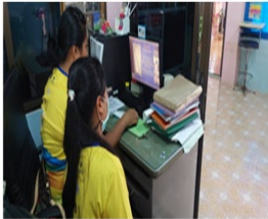
๘. รพ.สต.อำเภอป่าโมก