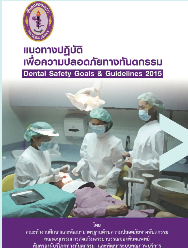
Dental Safety Goals & Guidelines 2015