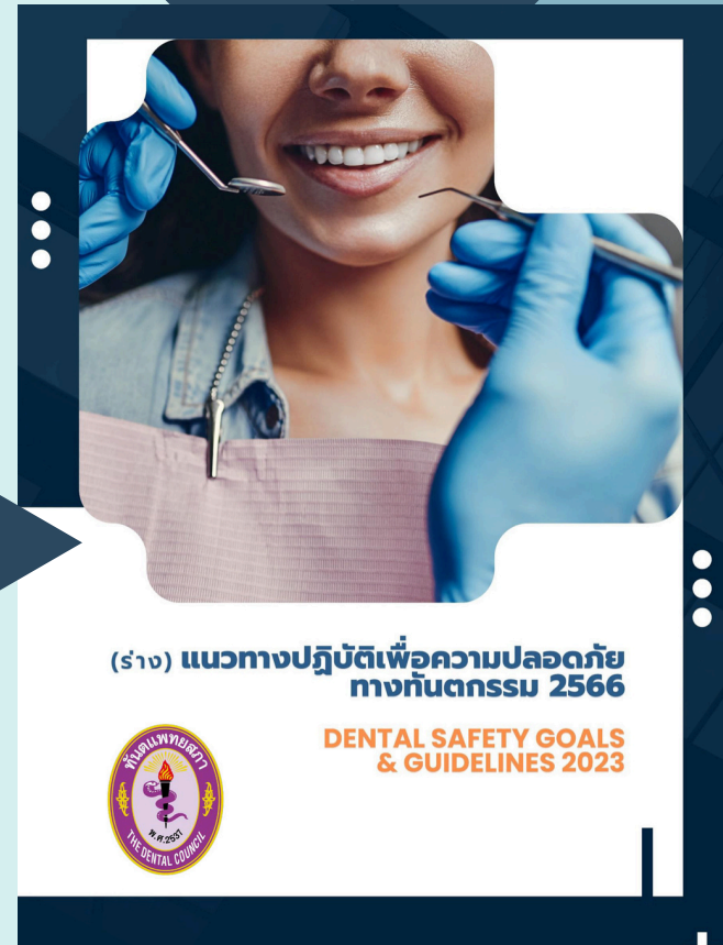
Dental Safety Goals & Guidelines 2023