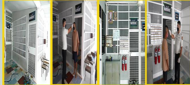
ห้องแยก/ห้องกักกันโรค

*อบรม อสรจ. เพิ่มเติมเมื่อวันที่ 3 - 7 ส.ค. 63