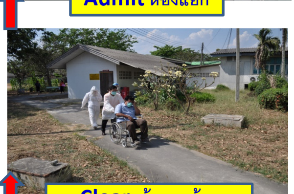
Clear เส้นทางย้าย