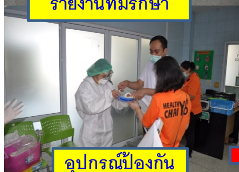
อุปกรณ์ป้องกัน