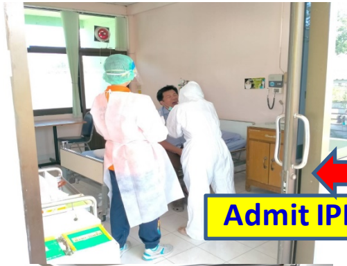
Admit IPD รอผลตรวจ