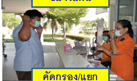
คัดกรอง/แยก