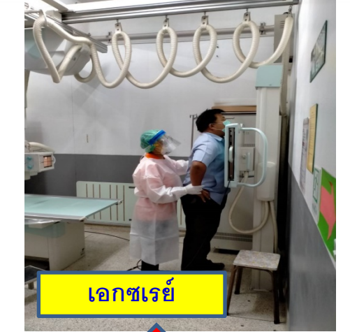
เอกซเรย์