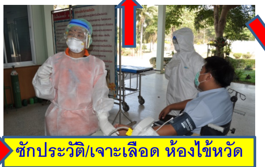
ซักประวัติ/เจาะเลือด ห้องไข้หวัด