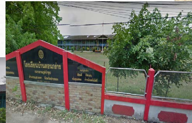
โรงเรียนบ้านดอนกร่าง