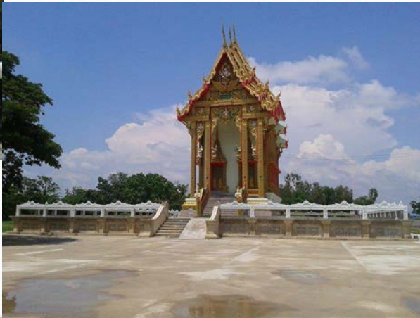
วัดดอนกร่าง