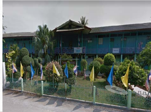
โรงเรียนชุมชนวัดริ้วหว่า