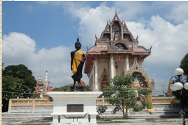
วัดริ้วหว่า