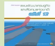
แผนพัฒนาเศรษฐกิจ และสังคมแห่งชาติ ฉบับที่ 12 (พ.ศ.2560 - 2564)