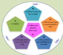
ยุทธศาสตร์ชาติระยะ 20 ปี และการปฏิรูปประเทศไทย ด้านสาธารณสุข